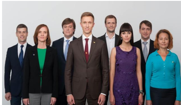
Bilder: ENTWICKLUNG VON BUSINESS, ARBEIT STATT VERGÜNSTIGUNGEN Entwicklung von KMU und neue Arbeitsplätze. Kiew soll eine Stadt von Unternehmertum, Innovationen und Investitionen werden - Ohne Geld für teure Billboards beschränkte sich die Partei „Kraft der Menschen“ auf Straßenwahlkampf und Facebook-Anzeigen / „Kraft der Menschen“-Bürgermeisterkandidat mit Team

Von den kleinen, sich transparent finanzierenden und tatsächlich um den Aufbau von dauerhaften lokalen Strukturen bemühenden Parteien – etwa „ Bürgerposition “ und „ Syla Lyudey “ ( Kraft der Menschen ) – ziehen Vertreter vor allem in die Räte kleinerer Gemeinden ein, wo nicht das Geld den Wahlkampf bestimmt. Die „ Bürgerposition “ schaffte es sogar mit 9,5 Prozent in das Lemberger Stadtparlament.